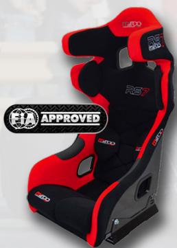
Mirco RS7 5500:-

Ni har väl inte missat att vi på RallyShop.se nu har lanserat vår nya webshop Apex.se? Utöver ett enormt utökat sortiment där vi breddar verksamheten för att inkludera exempelvis Racing, Gokart, Crosskart och Time Attack så har vår nya webshop en drös moderna funktioner såsom uppdaterat lagersaldo i realtid, kunsskapsbank, mobilanpassning och mycket mer! Allt för att kunna erbjuda så snabb och smidig service som möjligt!