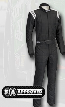
Sparco Conquest 2995:-