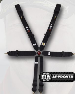
Apex 6p-bälte 995:-