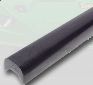
Burstoppning SFI 350:-